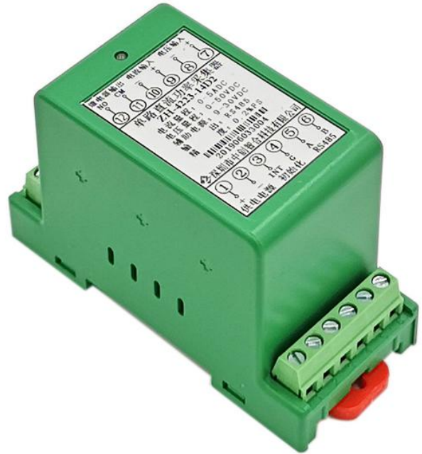
图 4.2、电流端子输入产品外观图（导轨安装）