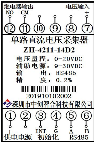
图 5.1、单电压产品接线图