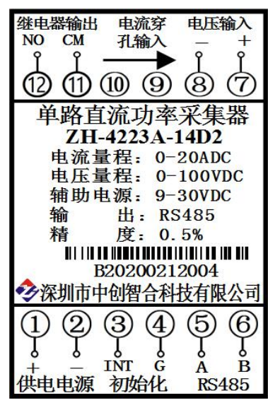
图 5.3、组合型电流穿孔输入接线图