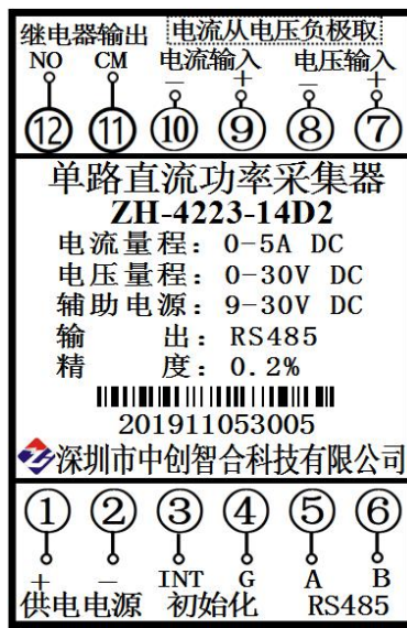
图 5.2、组合型电流端子输入接线图