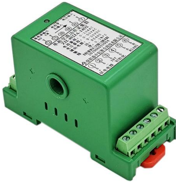
图 4.1、外观图（导轨安装）