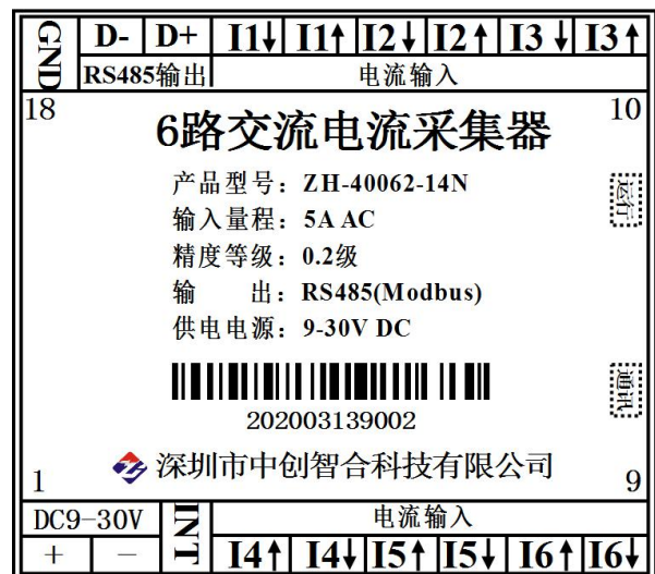
图 5.2 6路电流输入引脚定义图