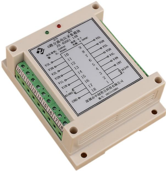
图 4.1、外观图（导轨安装）