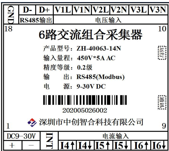
图 5.3 3路电压3路电流组合引脚定义图（功率测量时电压要与电流通道对应，如V1与I4为一组通道）