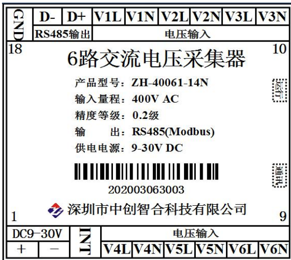
图 5.1 6路电压输入引脚定义图