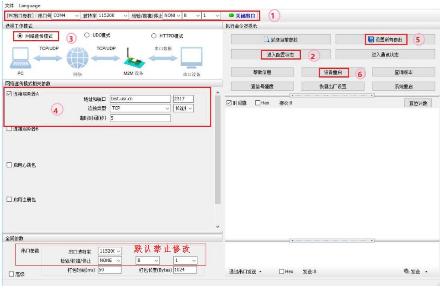
图 1.参数初始设置软件参考

注意事项： 点击第 2 步进入配置状态后，需等待串口回传一个“OK”，才可以进入下一步操作；