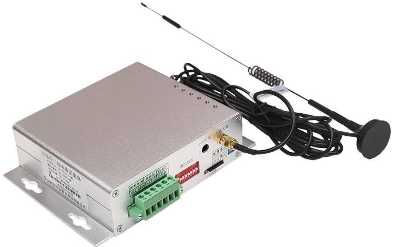
图 4.1、电流端子输入外观图 (外观尺寸: 129*150*38 mm, 安装尺寸:135*55 mm)